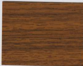
Allure Walnut Brown 100s + Allure Walnut