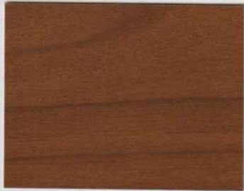
Cherry Brown 100s + Cherry