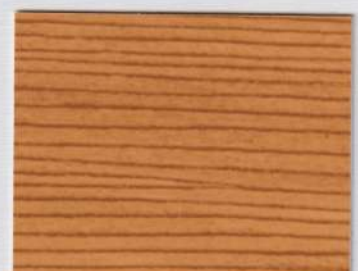
Douglas Beige 200s + Douglas