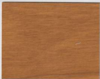
Hazelwood Beige 200s + Hazelwood