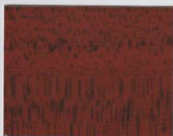
Elm Red 400s + Elm