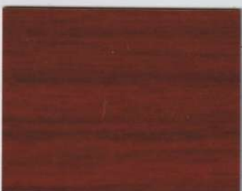
Allure Walnut Red 400s + Allure Walnut