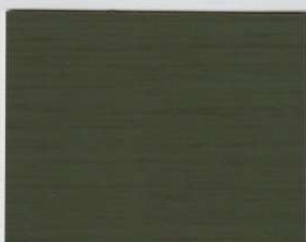
Oak Finline Green 300s + Oak Finline