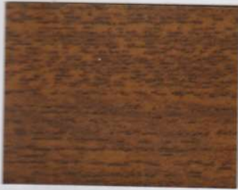
Olivewood Brown 100s + Olivewood