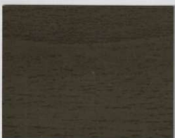
Walnut Green 300s + Walnut