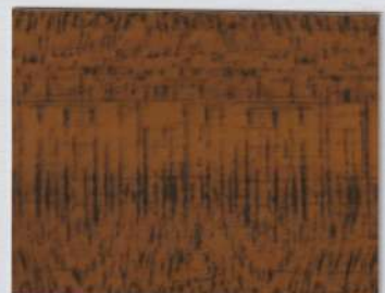
Elm Brown 100s + Elm