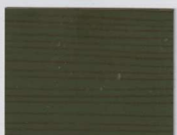
Douglas Green 300s + Douglas