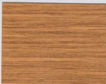
Oak Finline Beige 200s + Oak Finline