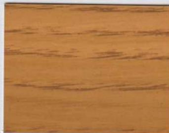
Chesnut Beige 200s + Chesnut