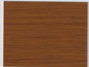
Oak Finition Brown 100s + Oak Finition