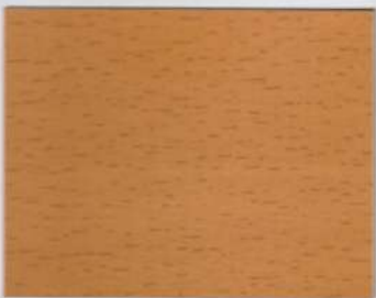
Beech Beige 200s + Beech