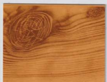
Pinewood Beige 200s + Pinewood