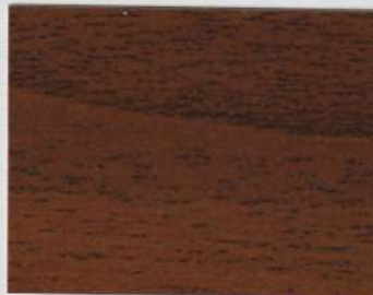
Walnut Brown 100s + Walnut